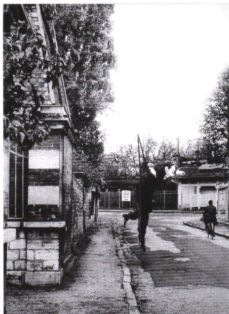
Salto al vacío con careta de Rem Koolhaas.

Por Nacho Fernández Torres, Curro González de Canales Ruiz y Ángel Martínez García-Posada. Ilustraciones de Carlos G. Cuenca