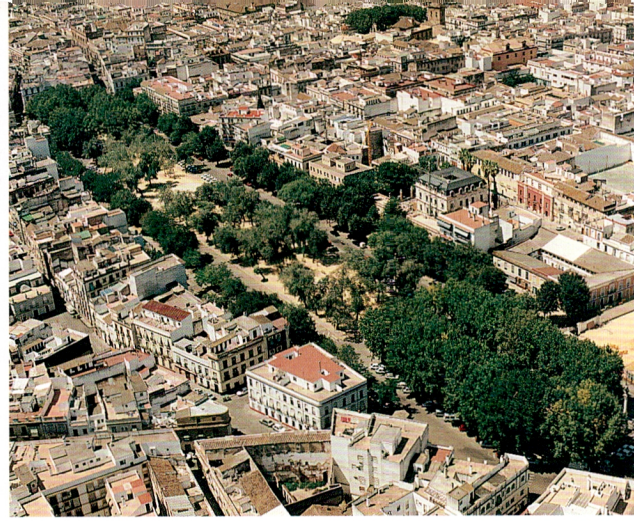
Alameda de Hércules