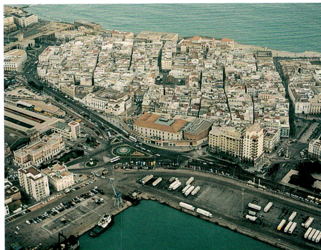
Barrio de Santa María