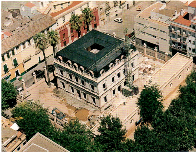
Casa de Las Sirenas

Algaba. Edificio en total estado de ruina que fue construido en el siglo XV, actuando como elemento generador de la gran manzana del norte del sector en el que se ubica. La importancia de su restauración es vital, no sólo en sí misma, sino además como resolución de la conexión comercial de las calles Feria y Amargura, dado que llevaba bastantes años apuntalado hacia la plaza de Calderón de la Barca, que actúa como charnela, con el mercado de la Feria, de ambas calles. Este palacio, cuya superficie construida es de aproximadamente 2.300 m 2 , se dedicará a resolver las dotaciones de "Centro de Día" tanto de la infancia como la tercera edad. Actualmente, está en ejecución la primera fase de dichas obras.