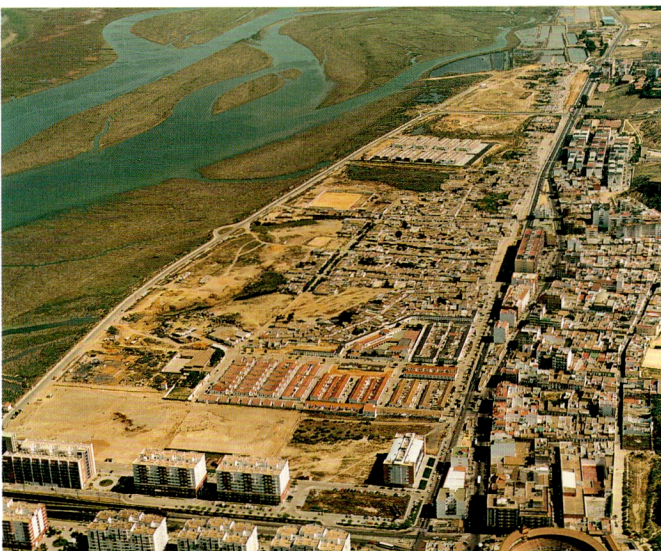
Marismas del Odiel