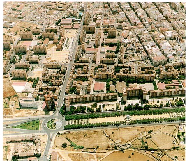
Polígono de San Sebastián

la población y que sirva de referencia como centro de servicios sociales comunitarios y como centro de distrito.