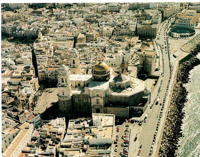
Barrio de El Pópulo

Evidentemente, tanto la estrategia general del proyecto, como todo el conjunto de medidas descritas en que se concreta, han de ser objeto de gestión y seguimiento, para lo cual se ha creado una estructura organizativa formada por el Consejo Rector, con la Comisión Municipal de Gobierno, la Comisión Consultiva con grupos de asesoramiento, formada por expertos en todos y cada uno de los ámbitos de actuación de Urban Cádiz y un equipo de Gestión formado por técnicos municipales bajo la presidencia del Teniente de Alcalde de Fomento.