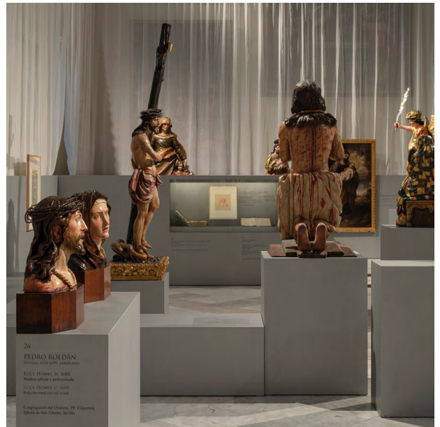
26 PEDRO ROLDÁN SEVILLA, 1624-1699 ECCE HOMINO, 1688 Madera tallada y policromada ECCE HOMINO, ca. 1688 Policromado tallado en madera Compañía de Cristo, PP. Filippini, Iglesia de San Alberto, Sevilla